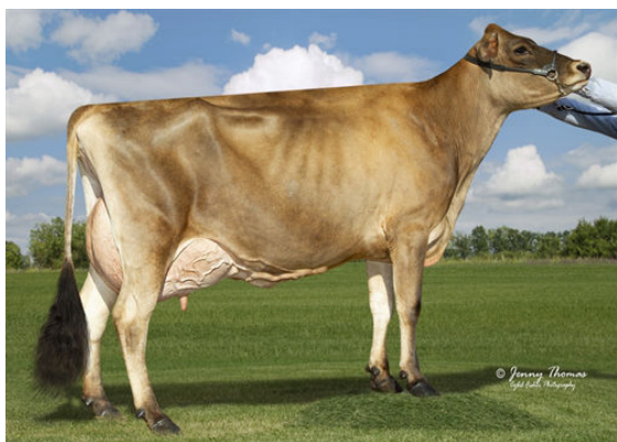
RACHELLES VICEROY LOUISE GRANDDAM